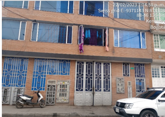
Foto No.1. Fachada del predio