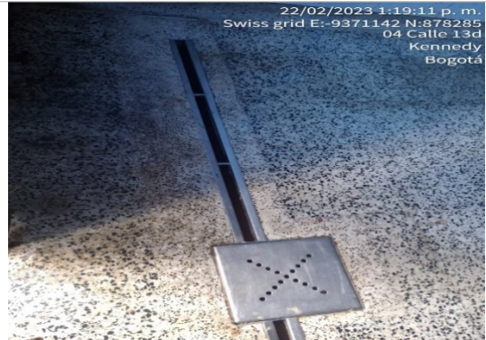
Foto No.4. Cárcamos, rejillas