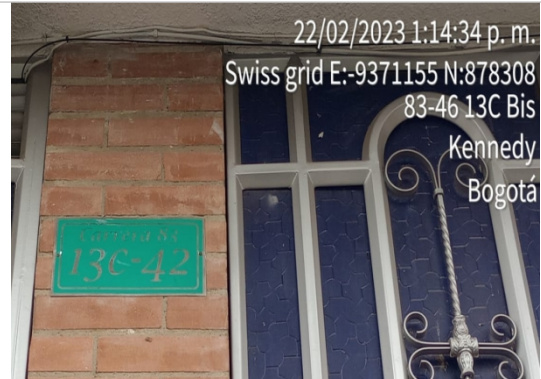
Foto No.2. Nomenclatura del predio