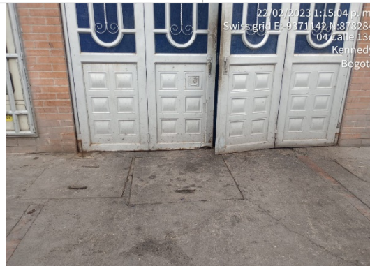
Foto No.5. Ubicación Caja de Inspección Externa