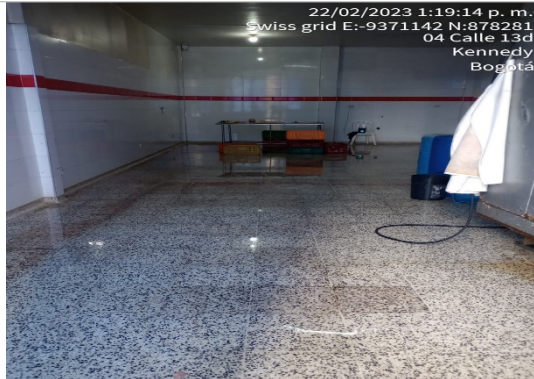
Foto No.3. Área de trabajo